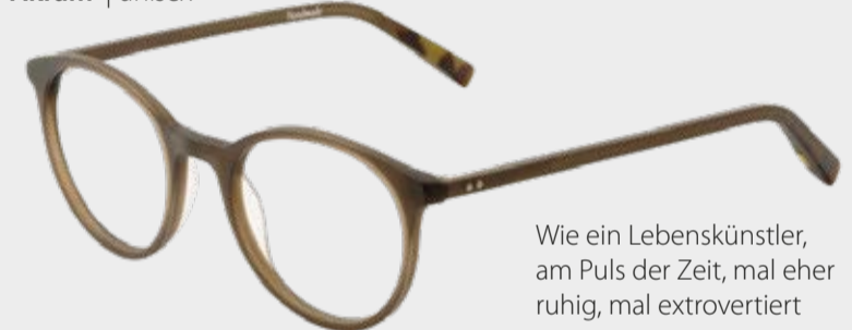
Akram | unisex

Wie ein Lebenskünstler, am Puls der Zeit, mal eher ruhig, mal extrovertiert