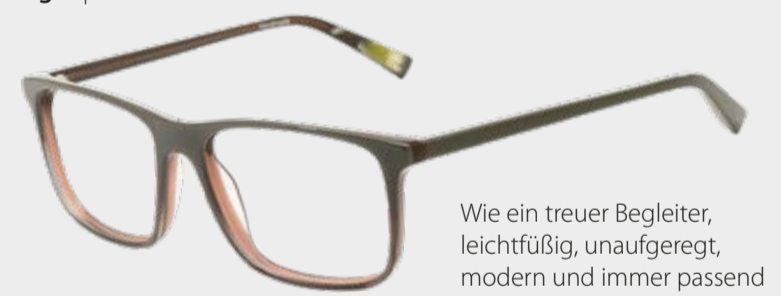
Regis | für ihn

Wie ein treuer Begleiter, leichtfüßig, unaufgeregt, modern und immer passend