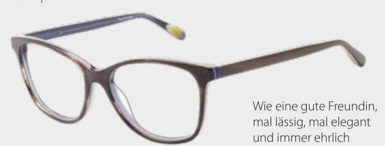
Tessa | für sie

Wie eine gute Freundin, mal lässig, mal elegant und immer ehrlich