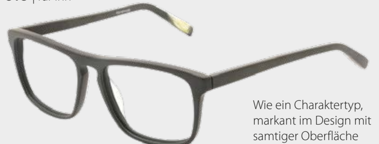
Ove | für ihn

Wie ein Charaktertyp, markant im Design mit samtiger Oberfläche