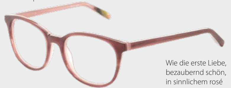
Therese | für sie

Wie die erste Liebe, bezaubernd schön, in sinnlichem rosé